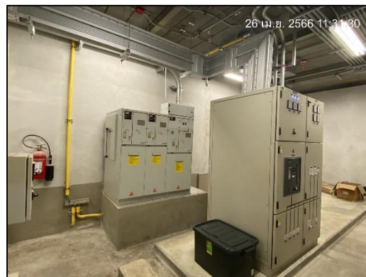
ภาพที่ 1.6-1 สถานภาพการก่อสร้างโครงการในปัจจุบัน